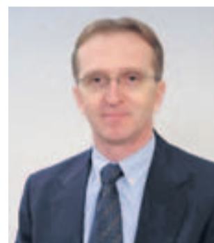
Mladen Dominić Krstova Crkva

U novogodišnjoj noći mnogi su donijeli neke odluke koje su važne za njihov život: idem na dijetu, počeo ću redovito vježbati, neću više piti alkohol, počeo ću redovito učiti, svaki ću tjedan pročitati jednu knjigu, više ću vremena provoditi s obitelji... No, već sredinom siječnja isto tako mnogi uviđaju da su se vratili na staro te tako budu nezadovoljni. Zašto se ljudi vraćaju na staro? Zašto osoba, koja se odlučila za dijetu, ponovo prekomjerno jede? Ili oni koji su odlučili vježbati, ostaju rade ležati pred televizorom, nego napraviti nekoliko čučnjeva i zgibova? Dobre stvari neće se dešavati same od sebe. Za dobro je potrebna odluka, akcija i trud. U mnogim slučajevima da bi bilo ploda treba ustrajnost. A sve je to u kategoriji moje odluke.